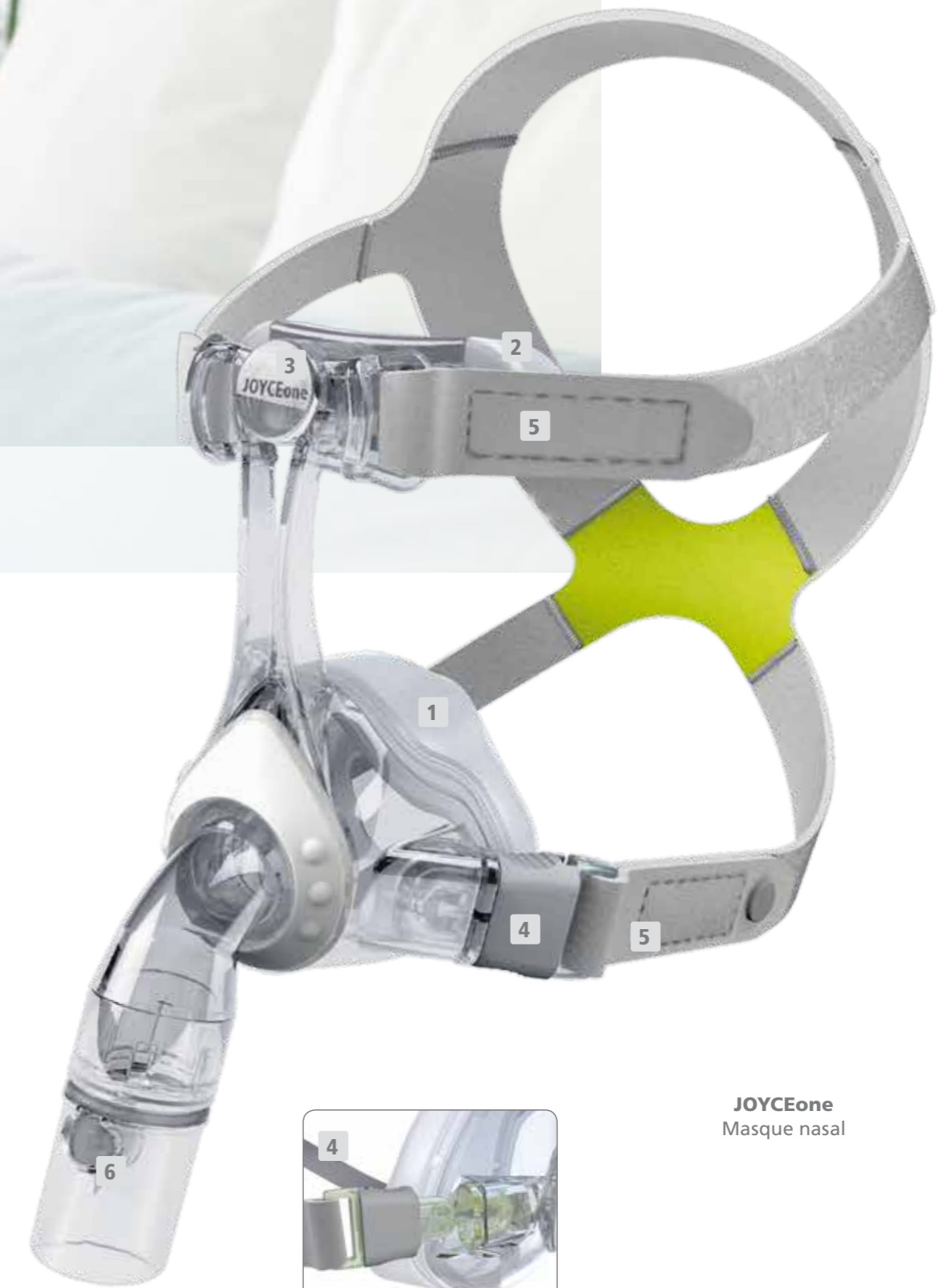
JOYCEone Masque nasal