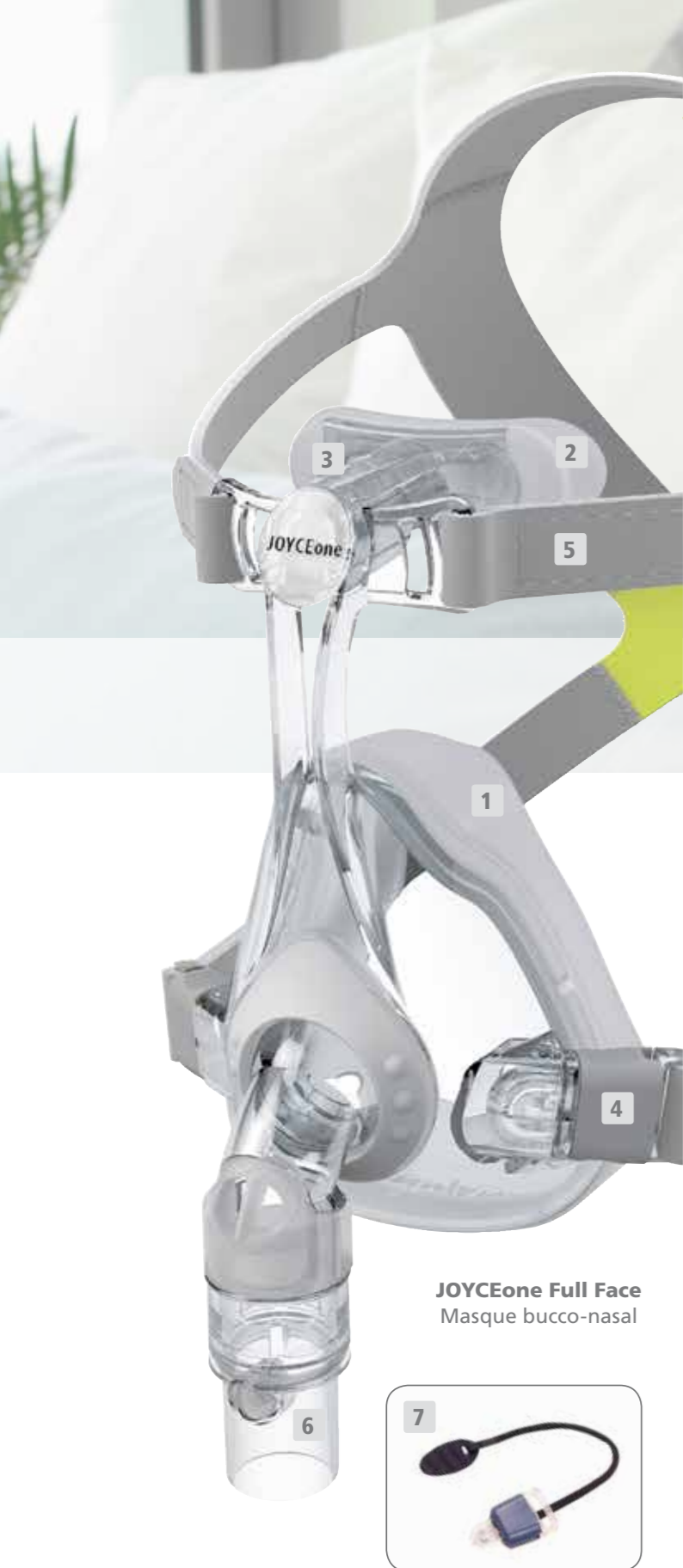
JOYCEone Full Face Masque bucco-nasal